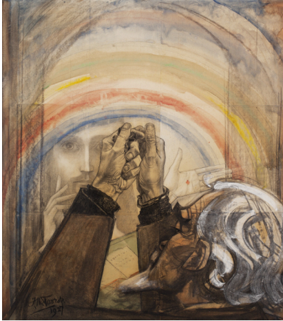
AFBEELDING 3: Het gebed , zelfportret door Jan Toorop, 1927 Stedelijk Museum Amsterdam

Het zelfportret 'Het gebed', het 'vuistgebed', is dan ook een intens en haast smekend portret van de kunstenaar die met zijn niet ineengestrengelde, maar ineengevouwen handen, bijna als vuisten, naar de Jezusfiguur reikt die in een