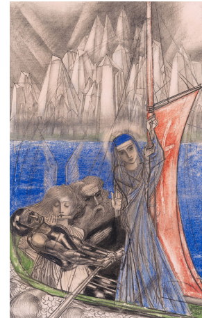
AFBEELDING 7: De levensreis van de kunstenaar, 1925