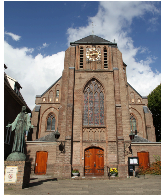
AFBEELDING 15: De Sint Bernulphuskerk met daarvoor het Heilig Hartbeeld

De kruisweg kende in zijn eerste tijd zowel meer als minder staties dan veertien, onder andere een vijftiende statie die de verrijzenis van Christus verbeeldde. In de achttiende eeuw besloot Paus Clemens XII die paus was van 1730 tot 1740, dat de kruisweg veertien staties moest omvatten. Zijn opvolger Paus Benedictus XIV verplichtte in 1741 dat in iedere Rooms-Katholieke kerk een kruisweg aanwezig moest zijn.