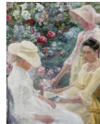
AFBEELDING 12: Trio Fleuri Kunst- museum Den Haag Impressionisme 1886

Vanuit de Rijksacademie in Amsterdam en de Academie van Schone Kunsten in Brussel, maakte Jan Toorop een ontwikkeling in stijl mee. Hij werd eerst gegrepen door het impressionisme. De zeggingskracht van sfeer en indrukken (impression) van het impressionisme ( gerichtheid op de beleving van het moment ), de schilderijstijl waarmee Toorop startte, stond voor hem mogelijk symbool voor de magie van het schimmenspel van de Wajang, waar indrukken opgeroepen werden en niet zozeer de realiteit getoond werd, maar het de bedoeling was om een beleving op te roepen.