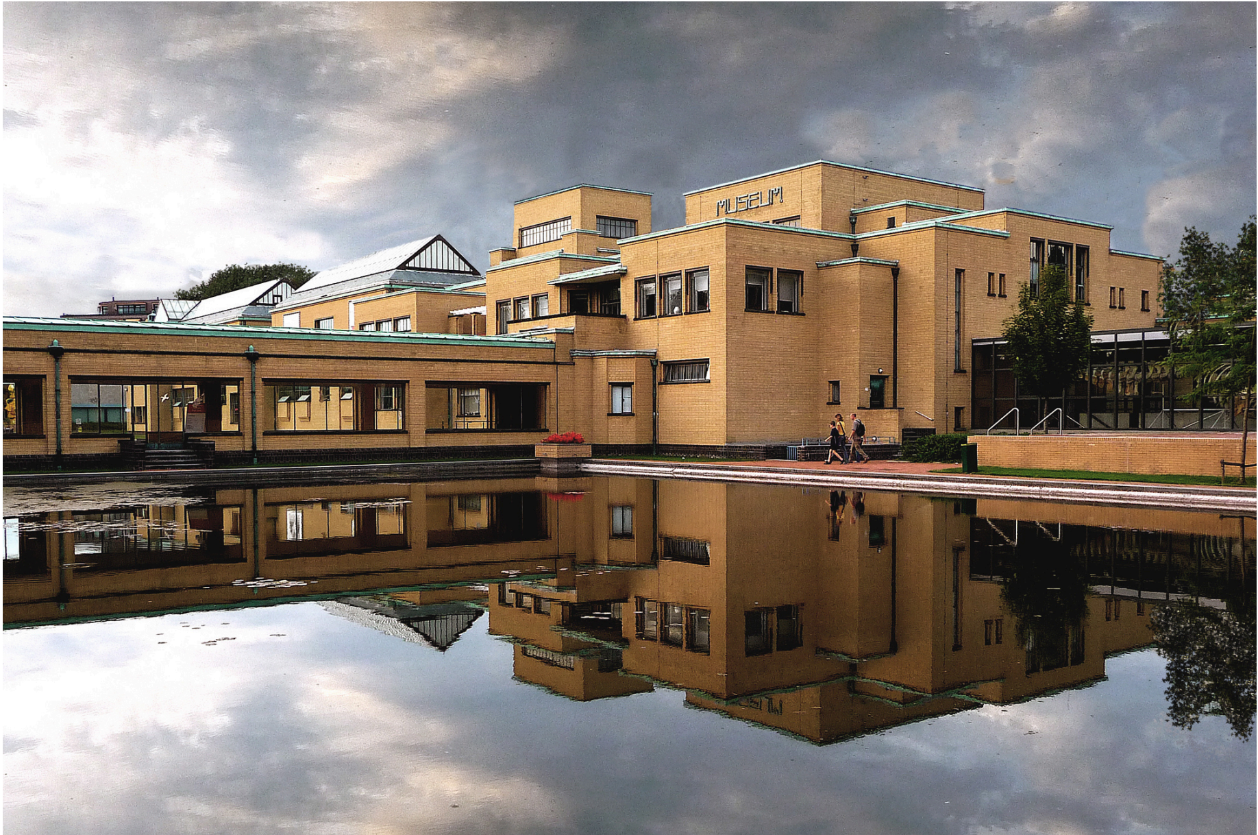
Kunstmuseum den Haag, Architect Berlage, Foto Roel Wijnants.

https://commons.wikimedia.org/w/index.php?curid=5071777