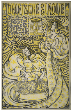
AFBEELDING 9: Delftsche Slaolie 1898 Rijksmuseum Amsterdam

Jan Toorop wordt gezien als een van de meest veelzijdige kunstenaars van zijn tijd. Hij maakte zowel een glas-in-lood raam voor een kerk, impressionistische en symbolistische schilderijen als postzegels of reclameaffiches. Zijn affiche voor Delftsche Slaolie werd het meest bekend en de op dat moment nieuwe, zwierige stijl, werd naar aanleiding van dit affiche de 'slaoliestijl' genoemd. Toorop maakte ook boekomslagen, zoals voor het boek Psyche van de door hem bewonderde Louis Couperus en tekende ook een kaart van Azië in zijn middelbare schooltijd. Dit laatste doet vermoeden dat hij soms mogelijk uit heimwee tekende.