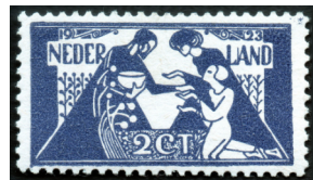
AFBEELDING 10: Postzegel 1923