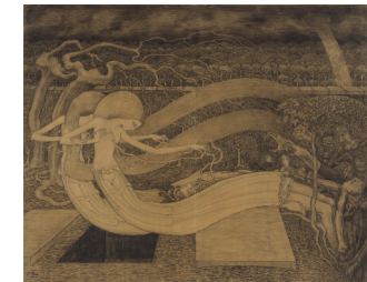
AFBEELDING 14: O grave, where is thy victory? Rijksmuseum Amsterdam Symbolisme 1892

Daarna werd hij gegrepen door het pointillisme ( waarbij de kleuren van ongemengd gekleurde stippen optisch door hun nabijheid lijken te vermengen en er zo een beeld ontstaat ) van onder andere zijn vriend Georges Seurat. Ook hier gaat het niet om een realistische weergave, maar een indruk die zich tot een beeld vormt. Uiteindelijk werd zijn stijl die van het symbolisme ( hang naar het verleden, het onderbewuste, het onverklaarbare, het ongewone ) vermengd met Jugendstil / Art Nouveau ( inspiratiebron vaak de natuur, langstelige bloemen, gestileerde vormen, slanke vrouwen, belettering niet mechanisch maar natuurlijke vormen ). Deze stijlen trokken