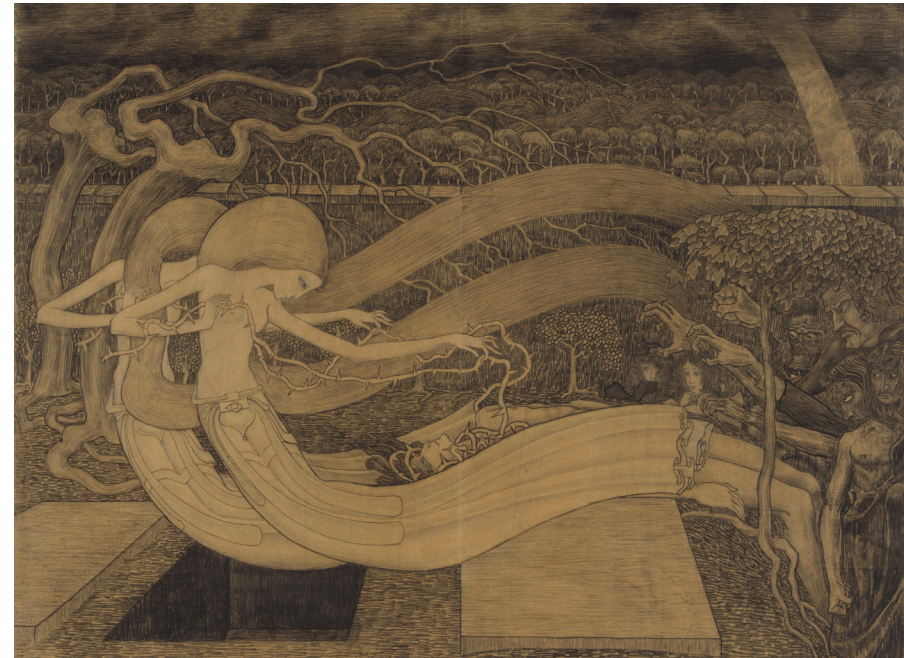
AFBEELDING 5: Oh grave, where is thy victory? Jan Toorop 1892 Rijksmuseum Amsterdam