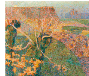
AFBEELDING 13: Novemberzon Kunstmuseum Den Haag Pointillisme 1889