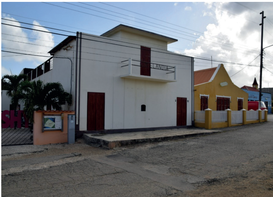
Teatro Cinelandia di Cornelis Crestian na Rincon.