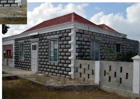
Kas di famia Crestian “Lo Veremos”