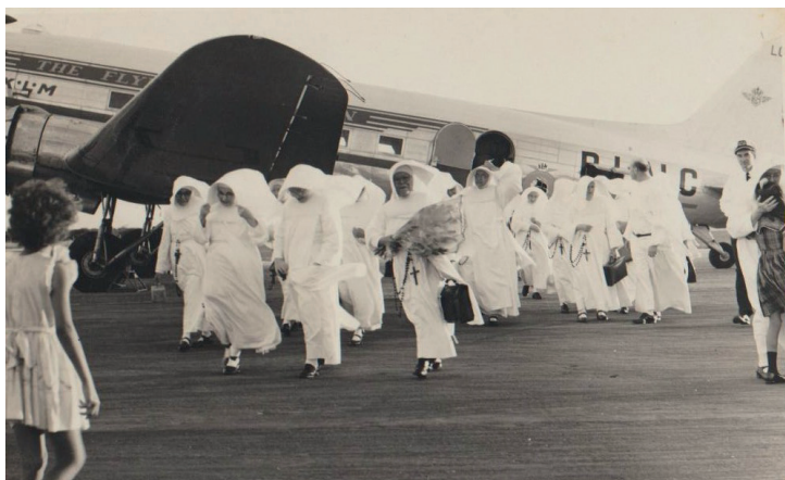
Sùrnan di Roosendaal yegando Boneiru.

E ta kòrdá kon dia a selebrá 100 aña di fundashon di Sùrnan di Roosendaal ku tabatin un fiesta chikí na Konbentu Alverna, i ku pader Römer a splika ku sùrnan di Roosendaal semper a traha pa muchanan di Otrobanda i nunka di Punda.