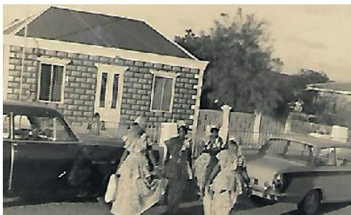
Kas di famia.