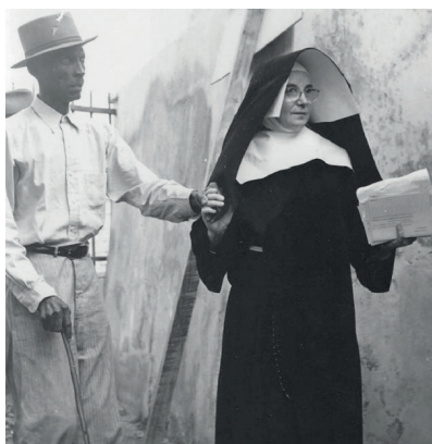
Sùrnan di Roosendaal yegando Boneiru.